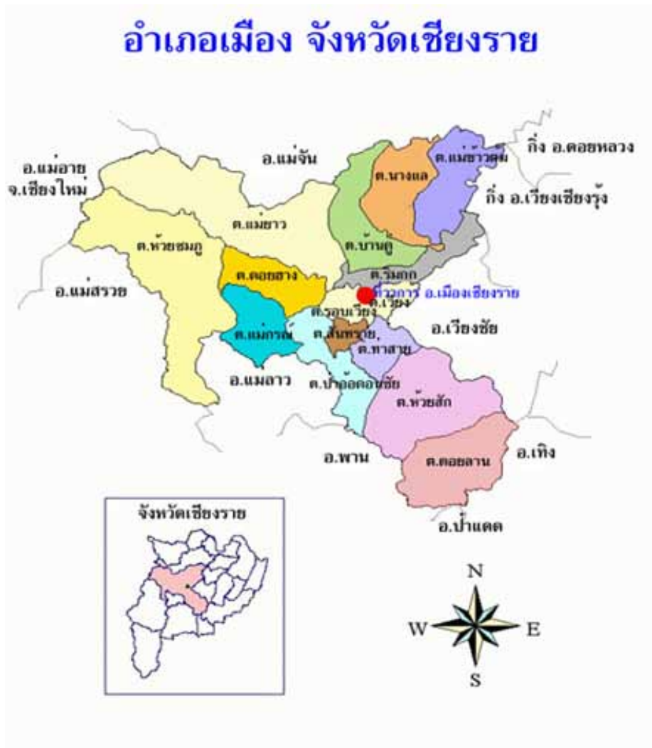
แผนที่อำเภอเมืองเชียงราย จังหวัดเชียงราย

อำเภอเมืองเชียงราย เป็นอำเภอหนึ่งของจังหวัดเชียงรายตั้งอยู่ทางตอนกลางของจังหวัด มีพื้นที่ทั้งหมด 1,415.50 ตารางกิโลเมตร ตั้งอยู่ในพิกัด ละติจูด 19 องศา 52 ลิปดา 15.1 พิลิปดา เหนือ และ ลองจิจูด 99 องศา 46 ลิปดา 57.7 พิลิปดา ตะวันออก มีอาณาเขตทิศเหนือติดต่อกับอำเภอแม่จัน ทิศใต้ติดต่อกับอำเภอแม่ลาว อำเภอพาน อำเภอป่าแดด และอำเภอเทิง ทิศตะวันออกจดเขตอำเภอเวียงชัยและอำเภอเวียงเชียงรุ้ง ส่วนทิศตะวันตก จดเขตอำเภอแม่สรวย และอำเภอแม่อาว จังหวัดเชียงใหม่ อำเภอเมืองเชียงรายแบ่งการปกครองออกเป็น 15 ตำบล 228 หมู่บ้าน 1 เทศบาลนคร 3 เทศบาลตำบล และ 12 องค์การบริหารส่วนตำบล