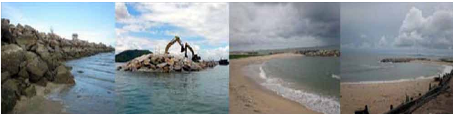
ภาพที่ 11 ตัวอย่างการป้องกันพิบัติภัย กำแพงกันคลื่น และรอดักตะกอนทราย เพื่อป้องกันการกัดเซาะชายฝั่ง