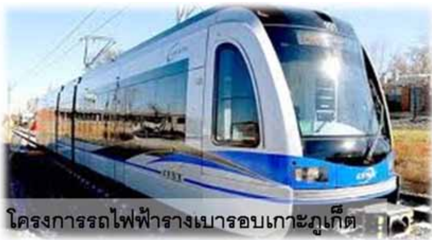
โครงการรถไฟฟ้างวดรอบเกาะภูเก็ต

การพัฒนาโครงสร้างพื้นฐานด้านการคมนาคมขนส่งและการท่องเที่ยวในปัจจุบัน นับว่าเป็นกุญแจสำคัญในการส่งเสริมด้านการท่องเที่ยว โดยเฉพาะอย่างยิ่งในจังหวัดภูเก็ต ซึ่งมีสภาพภูมิประเทศเป็นทะเลล้อมรอบ จึงเื้ออำนวยการประกอบอาหารทางทะเล และที่สำคัญคือต่อเรือ และซ่อมเรือ ด้วยจังหวัดภูเก็ตเป็นแหล่งท่องเที่ยวสำคัญทางทะเล จึงเป็นการบริการมากกว่าการผลิต และเป็นสถานที่สำหรับจอดเรือสำราญสำหรับนักท่องเที่ยว หากพิจารณาได้จากเศรษฐกิจแล้ว พบว่าภาคบริการและการท่องเที่ยวซึ่งเป็นเศรษฐกิจหลัก ของจังหวัด และภาคการเกษตร (ยางพารา) ที่ปรับตัวเพิ่มขึ้น ในขณะเดียวกันด้านการลงทุน การอุปโภคบริโภค ภาคเอกชนมีการขยายตัวเพิ่มขึ้นเช่นเดียวกัน