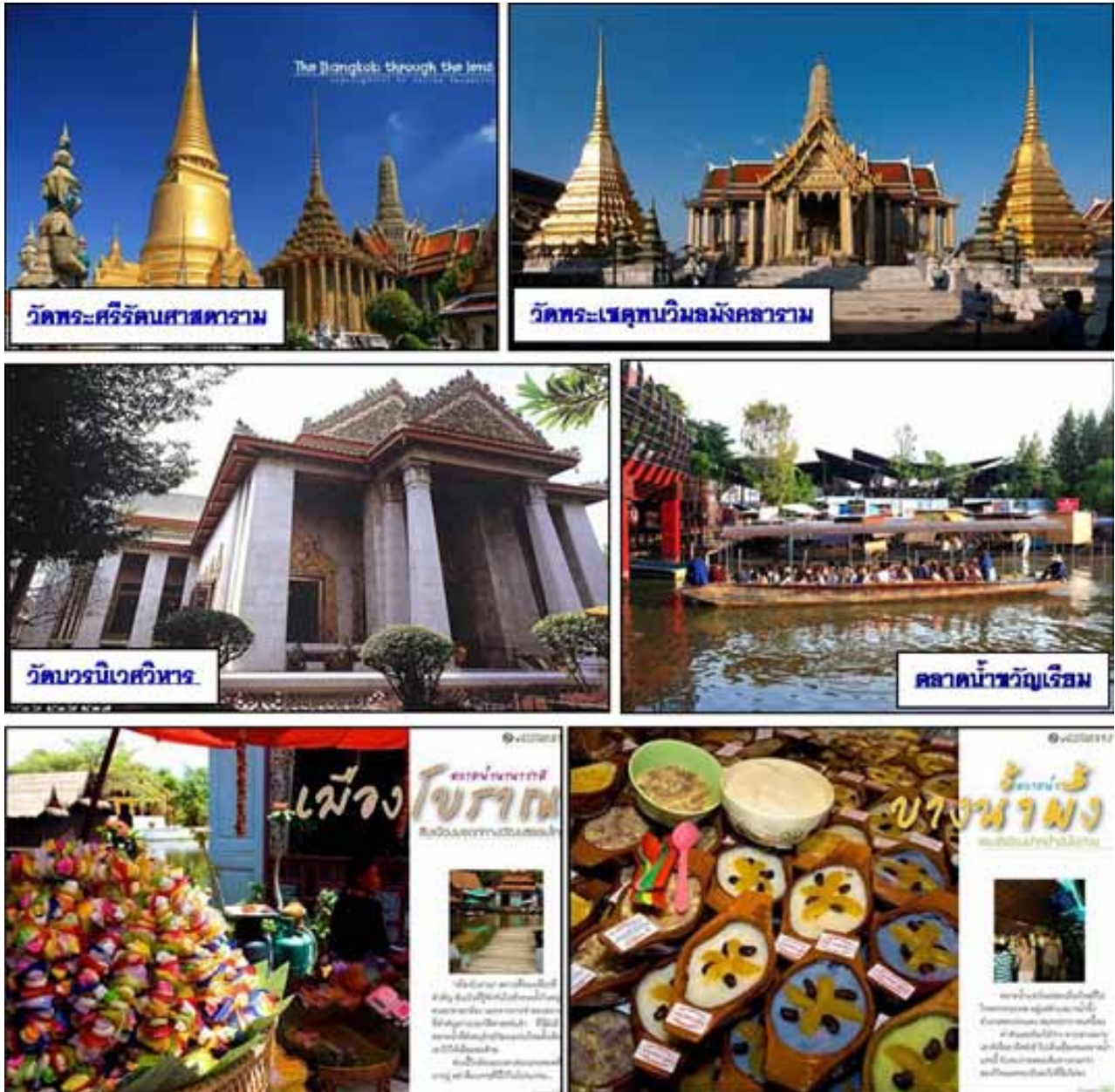
ภาพที่ 3 สถานที่ท่องเที่ยวของภาคกลาง

ภาคกลางตั้งอยู่บนพื้นที่ลุ่ม มีแม่น้ำหลายสายไหลผ่าน และก่อให้เกิดวัฒนธรรม ประเพณี และภูมิทัศน์อันโดดเด่น มีเส้นทางท่องเที่ยวตลอดลำน้ำ เพื่อเป็นแหล่งท่องเที่ยวเชิงอนุรักษ์และผลิตภัณฑ์จากภูมิปัญญาท้องถิ่น พร้อมเชื่อมโยงแหล่งท่องเที่ยวกับแหล่งผลิตจากภูมิปัญญาท้องถิ่น และสนับสนุนแหล่งที่พักในลักษณะของโฮมสเตย์ อีกทั้งภาคกลางยังมีความสะดวกในการคมนาคม และความพร้อมของโครงสร้างพื้นฐานที่เชื่อมเส้นทางไปยังภาคใต้ ที่มีพื้นที่เป็นภูเขาและชายทะเลที่สวยงาม