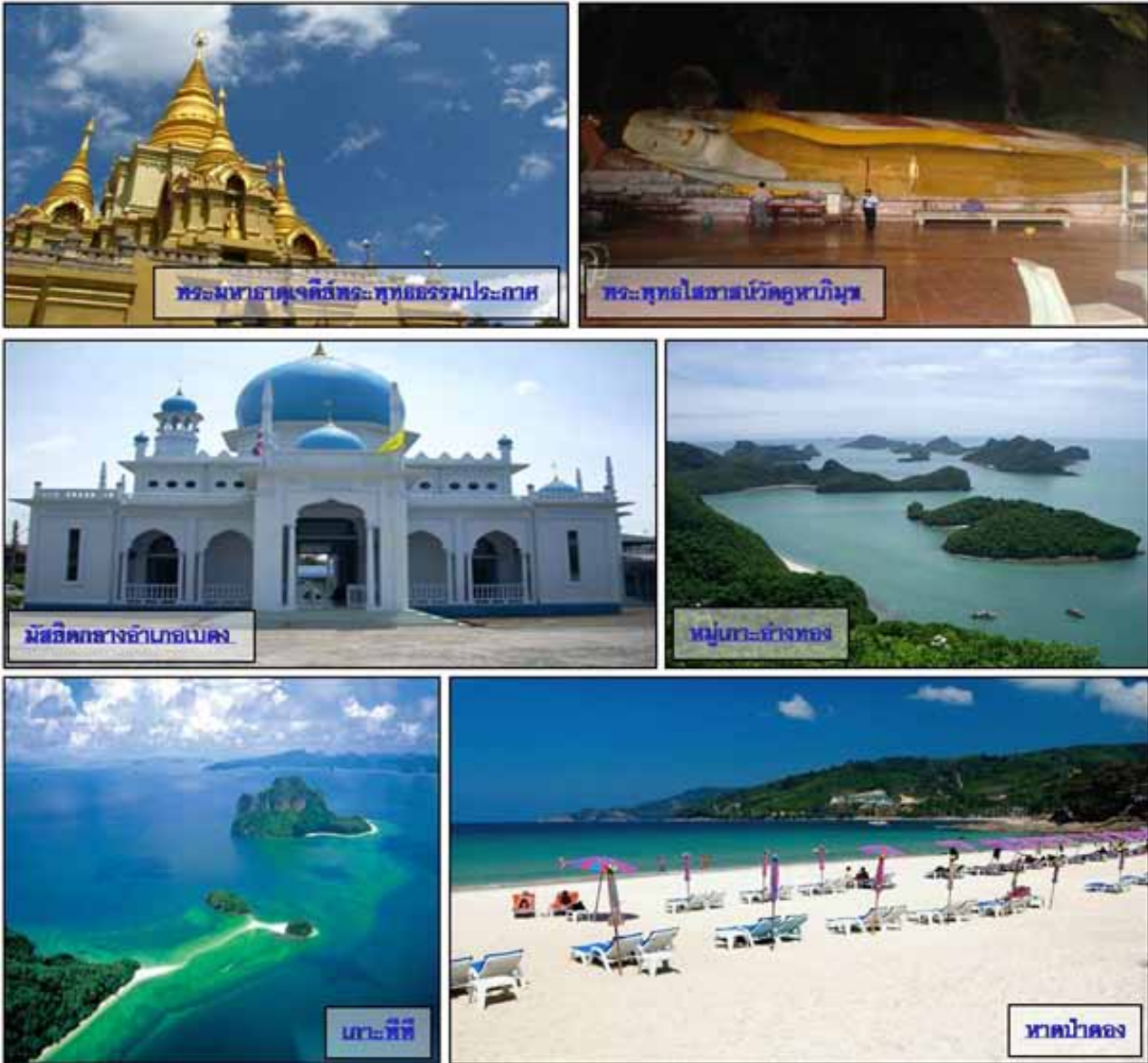
ภาพที่ 5 สถานที่ท่องเที่ยวของภาคใต้ ที่มา: http://www.unseentravel.com (2556)

ภาคใต้มีลักษณะพื้นที่เป็นเกาะ ภูเขา และชายฝั่งทะเล นักท่องเที่ยวนิยมท่องเที่ยวตามธรรมชาติทั้งทางทะเล เกาะ ที่เน้นกีฬาทางน้ำ ให้ความสนุกสนาน ตื่นเต้น และท่องเที่ยวธรรมชาติบนบก ที่มนุษย์สร้างขึ้น เช่น สวนสนุก มอเตอร์สปอร์ต และแหล่งวัฒนธรรม/โบราณสถาน และภูมิสังคมของภาคใต้