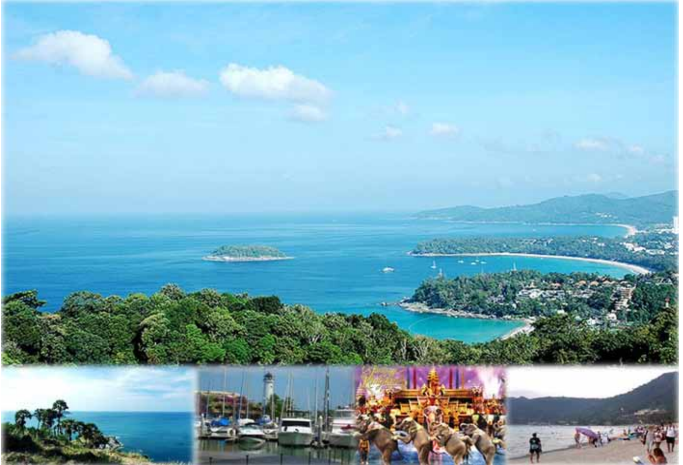
ภาพที่ 7 สถานที่ท่องเที่ยวจังหวัดภูเก็ต