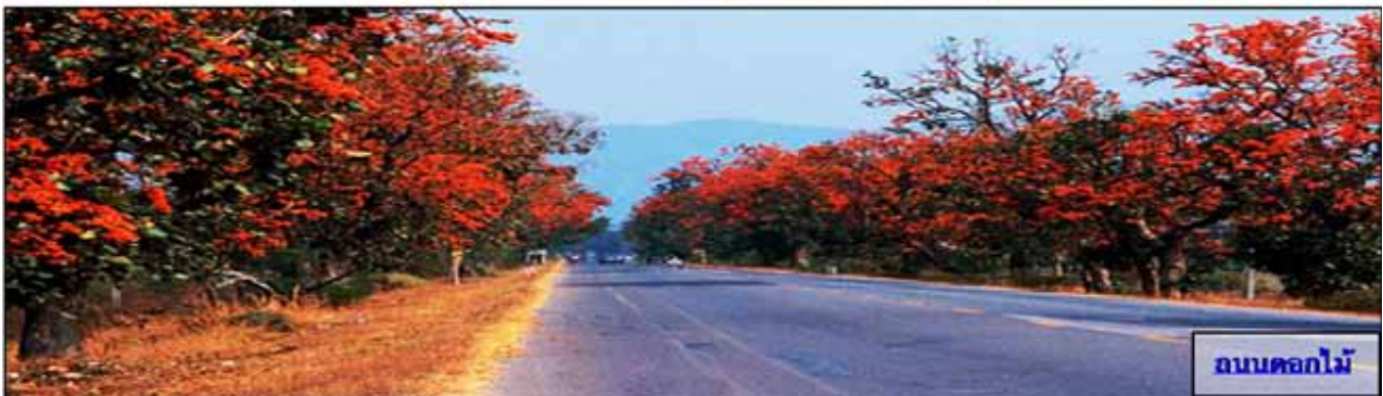
ภาพที่ 2 สถานที่ท่องเที่ยวของภาคเหนือ