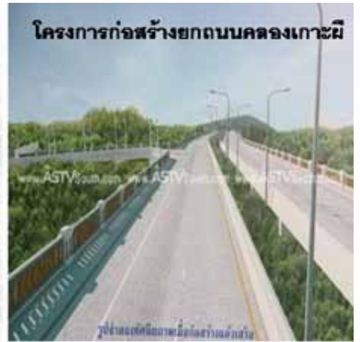
โครงการก่อสร้างยกถนนคลองเกาะมี