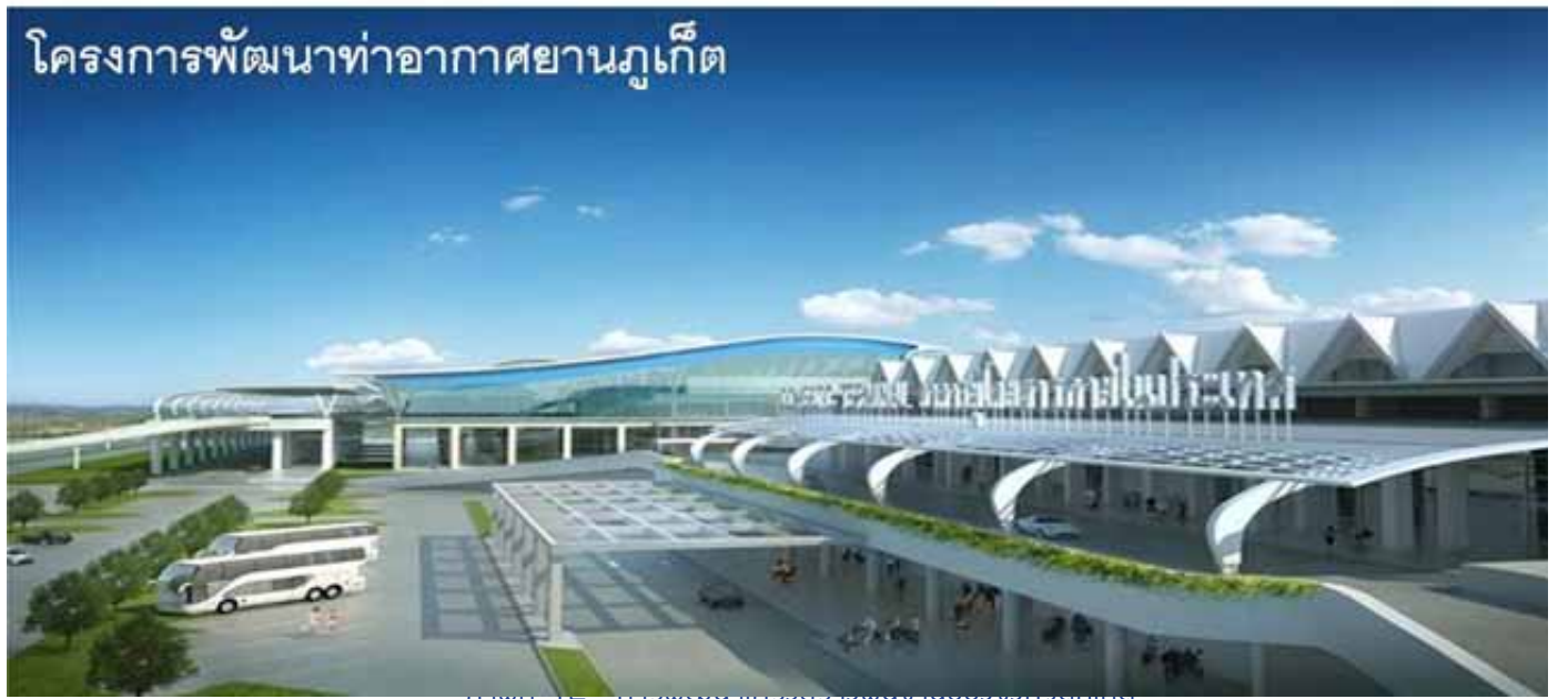
โครงการพัฒนาท่าอากาศยานภูเก็ต