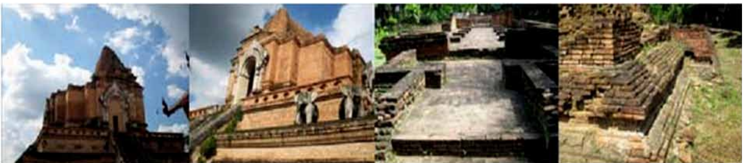
ภาพที่ 8 พิบัติภัยธรรมชาติในอดีตที่วัดเจดีย์หลวง และเวียงกุมกาม

ปัจจุบันอาจมีทั้งพิบัติภัยธรรมชาติหรือภัยพิบัติจากการกระทำของมนุษย์ อาทิ อุทกภัย อัคคีภัย หรือการวิบัติของอาคาร สิ่งปลูกสร้างที่ออกแบบ ก่อสร้างบกพร่อง หรือใช้งานอย่างผิดวิธี (ภาพที่ 10) พิบัติภัยที่เกิดขึ้น และทวีความรุนแรง ทำให้ต้องทบทวนกระบวนการพัฒนาโครงสร้างพื้นฐานโดยคำนึงถึงเทคโนโลยีที่เหมาะสม และความยั่งยืน ใช้บทเรียนจากอดีตเพื่อทราบสาเหตุการเกิดและการออกแบบที่เหมาะสม จะช่วยป้องกันบรรเทาความเสียหายได้ โครงสร้างพื้นฐานในปัจจุบัน และอนาคต จะต้องหมายรวมถึงการซ่อมบำรุง หรือรักษาสภาพ และการใช้งานของโครงสร้างพื้นฐานที่มีอยู่เดิม หรือการออกแบบ และสร้างเพื่อป้องกันบรรเทาความเสียหาย อาทิ งานป้องกันชายฝั่ง การออกแบบเพื่อต้านแรงลม หรือ แผ่นดินไหว (ภาพที่ 11) เป็นต้น