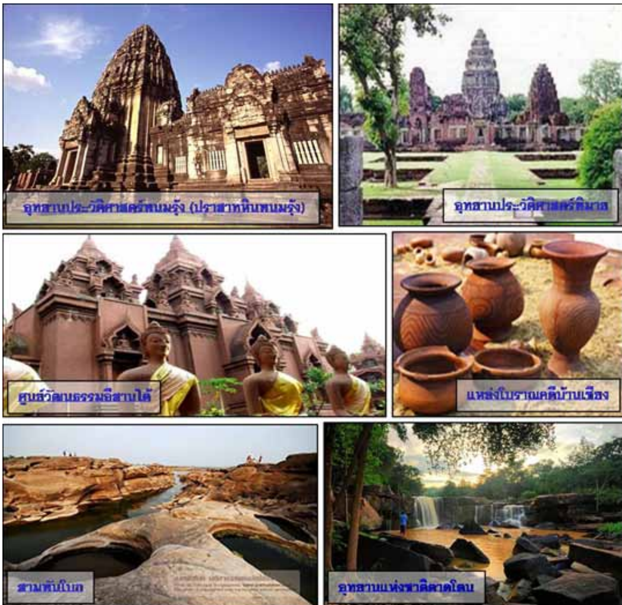
ภาพที่ 4 สถานที่ท่องเที่ยวของภาคอีสาน

ภาคตะวันออกเฉียงเหนือตอนบนและตอนล่างมีหลายจังหวัดมีพื้นที่ติดต่อกับแม่น้ำโขงเพื่อรองรับการขยายตัวบริเวณชายแดน เชื่อมโยงการท่องเที่ยวของประเทศไทย-ลาว มีการท่องเที่ยวเชิงศาสนา กิจกรรม ประเพณี ทั้งที่เป็นสถานที่สำคัญเชื่อมโยงกับประวัติศาสตร์ความเป็นมาของเกจิอาจารย์ดังที่มีชื่อเสียง และสำหรับแหล่งท่องเที่ยวในพื้นที่ภาคตะวันออกเฉียงใต้มีแหล่งท่องเที่ยวทางโบราณคดี ธรณีวิทยาในประเทศไทย ซึ่งเป็นศูนย์กลางการเรียนรู้โลกดึกดำบรรพ์ในภูมิภาคเอเชียตะวันออกเฉียงใต้