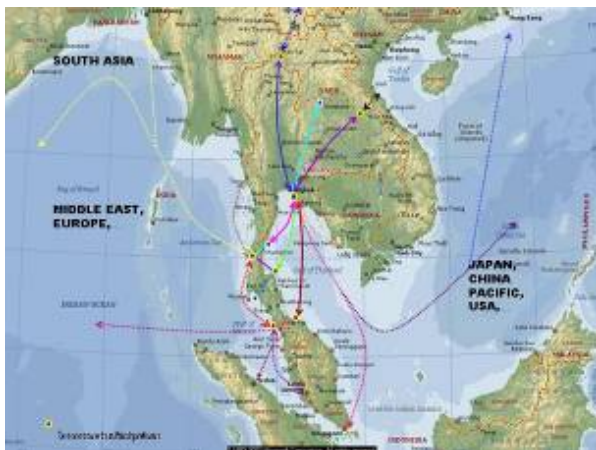
การสร้างสะพานเศรษฐกิจจะระหว่างสตูลและสงขลา ซึ่งเป็นเส้นทางผ่านหาดใหญ่ เพื่อเชื่อมโยงอันดามันและอ่าวไทย (ฝั่งกลยุทธ์ 15 ปี พ.ศ.2565)