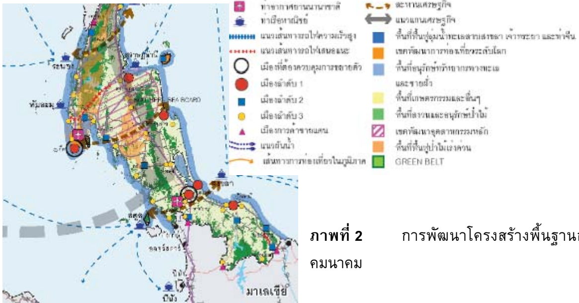
ภาพที่ 2 การพัฒนาโครงสร้างพื้นฐานการคมนาคม