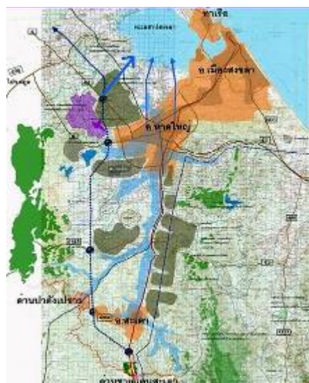
ท่าเรือน้ำลึกสงขลา 2 เพื่อเชื่อมโยงการขนส่งในอ่าวไทย ซึ่งจะมีเส้นทางคมนาคมเชื่อมผ่านกับเมืองหาดใหญ่ เนื่องจากเป็นศูนย์กลางเศรษฐกิจและระยะใกล้กับท่าเรือดังกล่าว