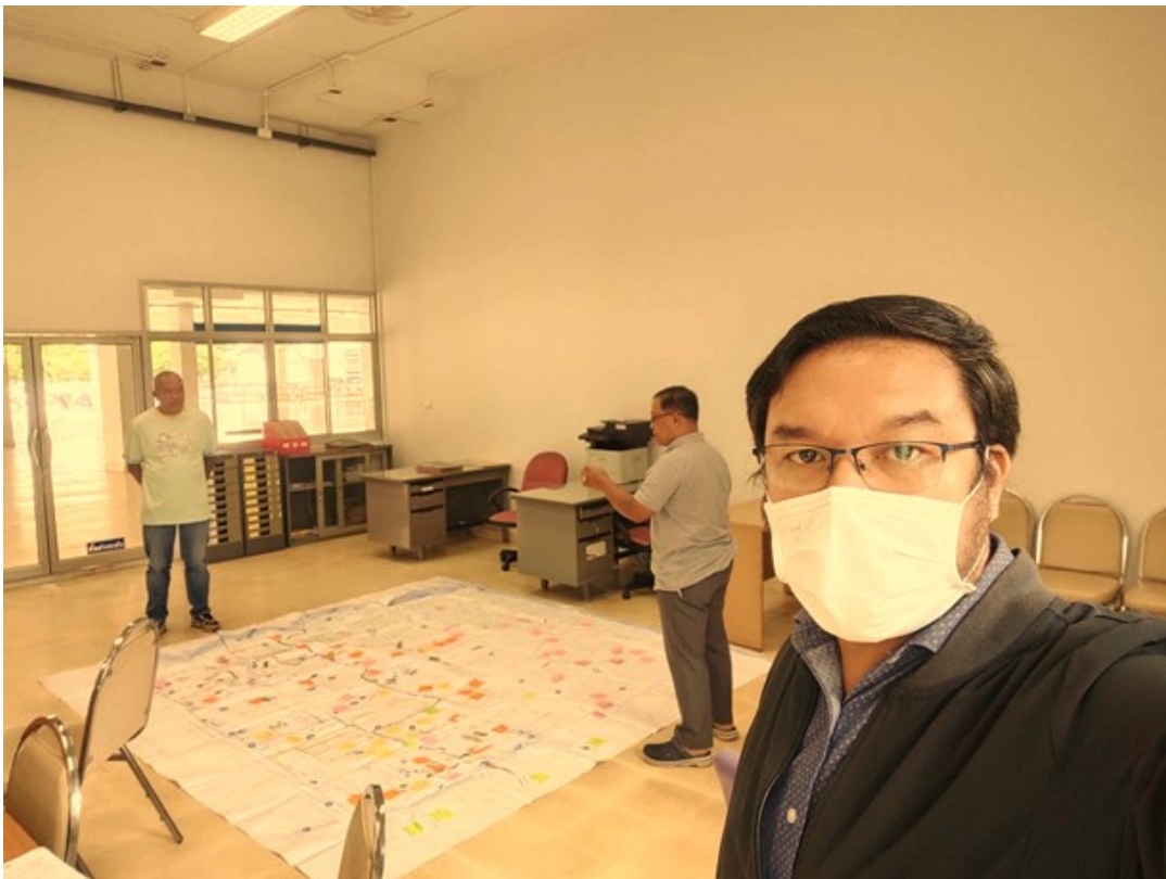
รายงานสรุปการประชุม(พื้นที่เมืองสามพร้าว) ครั้งที่ 1