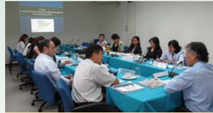
บรรยากาศการประชุม ณ ห้องบรรพต สถาบันสิ่งแวดล้อมไทย