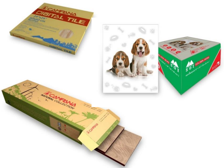
บริษัท เอสซีจี เซรามิกส์ จำกัด (มหาชน)

เมื่อ วันที่ 19 สิงหาคม 2562 สถาบันสิ่งแวดล้อมไทย โดยฝ่ายเลขานุการคณะกรรมการรับรองการลดหรือหลีกเลี่ยงการปล่อยก๊าซเรือนกระจกได้ดำเนินการจัดประชุมคณะกรรมการรับรองฯ ครั้งที่ 16-4/2562 ในวันพฤหัสบดีที่ 19 กันยายน 2562 เพื่อพิจารณาให้การรับรองการขึ้นทะเบียนฉลากลดคาร์บอนและต่ออายุฉลากลดคาร์บอน ที่ประชุมมีมติอนุมัติรับรองทั้งสิ้น 11 ผลิตภัณฑ์ จาก 4 บริษัท และอนุมัติรับรองการใช้หรือผลิตพลังงานหมุนเวียน 1 บริษัท