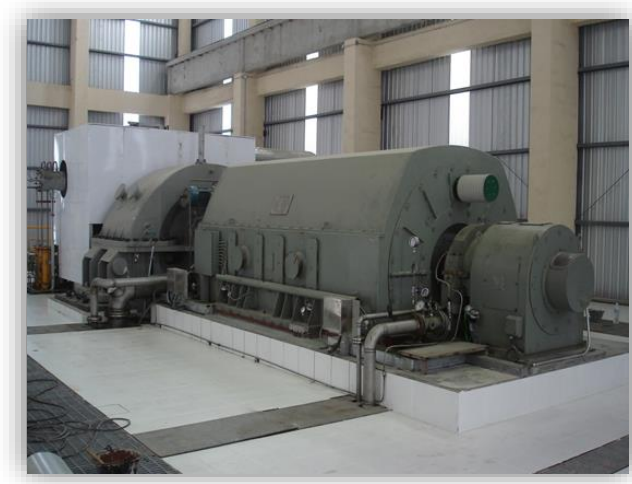
การนำพลังงานไฟฟ้าจากความร้อนทิ้งมาใช้ในกระบวนการผลิตปูนซีเมนต์ (Waste Heat Recovery Power Plant : WHRP) บริษัท ทีพีโอ โพลีน เพาเวอร์ จำกัด (มหาชน)