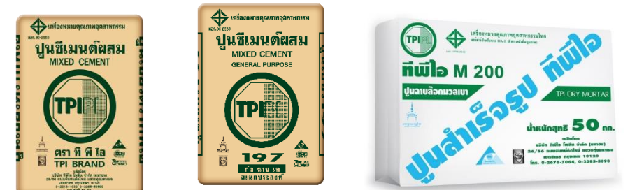
บริษัท ทีพีโอ โพลีน จำกัด (มหาชน)