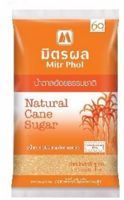
บริษัท น้ำตาลมิตรกาฬสินธุ์ จำกัด