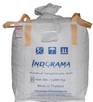
บริษัท อินโดรามา โปติเคมี จำกัด