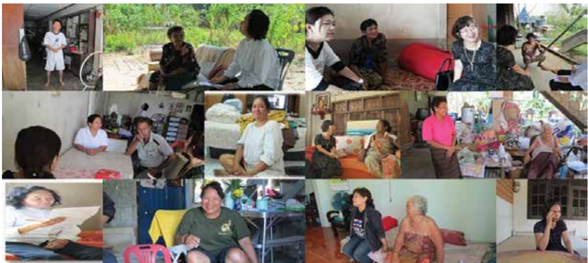
ภาพที่ 3 กลุ่มผู้ให้ข้อมูล