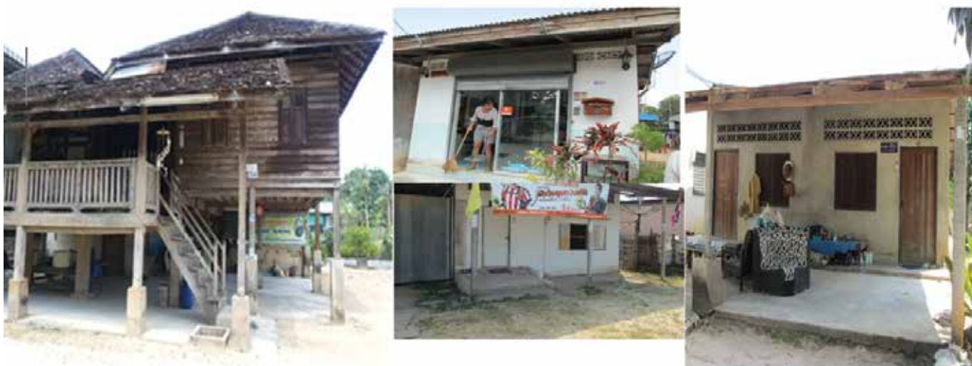
ภาพที่ 4 ลักษณะบ้านเรือนในอดีตและปัจจุบัน

การเปลี่ยนแปลงทางกายภาพในชุมชนซึ่งเป็นผลจากการเติบโตของเมืองยิ่งทำให้ชุมชนซึ่งเดิมก็ประสบปัญหาน้ำท่วมหลากตามฤดูกาล เนื่องจากเป็นพื้นที่ลุ่มรับน้ำจากพื้นที่โดยรอบอยู่แล้ว ต้องรับมือกับความรุนแรงของเหตุการณ์น้ำท่วมในปี 2543 และปี 2553 มากขึ้นอีก โดยเฉพาะอย่างยิ่งครอบครัวคนจน ซึ่งไม่มีทุนเดิมที่จะใช้จ่ายเพื่อฟื้นฟูการทำมาหากินจากความเสียหายของทรัพย์สินที่เกิดจากน้ำท่วมได้ เงินชดเชยที่ได้จากหน่วยงานภาครัฐครัวเรือนละ 5 พันบาทนั้น ไม่เพียงพอที่จะใช้จ่ายเพื่อชดเชยความเสียหายได้ พวกเขาจึงต้องกู้ยืมเงินจากแหล่งเงินกู้ต่างๆ ทั้งกลุ่มออมทรัพย์ในชุมชนและแหล่งเงินกู้นอกระบบ คนจนเมืองต้องพึ่งพิงทรัพยากรในการดำรงชีวิตทั้งหมดจากภายนอก เนื่องจากไม่มีฐานการผลิตเป็นของตนเอง อาทิ บางคนต้องเช่าที่อยู่อาศัย ไม่มีพื้นที่เพื่อการเพาะปลูกพืชผัก ข้าวปลาอาหารก็ต้องซื้อ การเดินทางก็ต้องใช้เงิน ตื่นเช้าก็ต้องออกจากบ้านไปทำงานตกค่ำ จึงเดินทางกลับบ้าน กินข้าวแล้วก็นอน ชีวิตของคนจนเมืองไม่ได้มีการปฏิสัมพันธ์กับเพื่อนบ้านรอบข้างมากนัก ชีวิตในแต่ละวันมุ่งหน้าทำมาหากินเพื่อความอยู่รอดของปากท้อง ความยากไร้ทำให้ขาดที่พึ่ง ที่พึ่งทางเศรษฐกิจมีเพียงแหล่งเงินกู้ ส่วนที่พึ่งทางสุขภาพมีเพียงบัตร 30 บาท ส่วนที่พึ่งยามชรามีเพียงเงินจำนวนเล็กน้อยที่รัฐบาลจัดสรรให้แก่ผู้ช่วยเหลือสูงอายุเท่านั้น