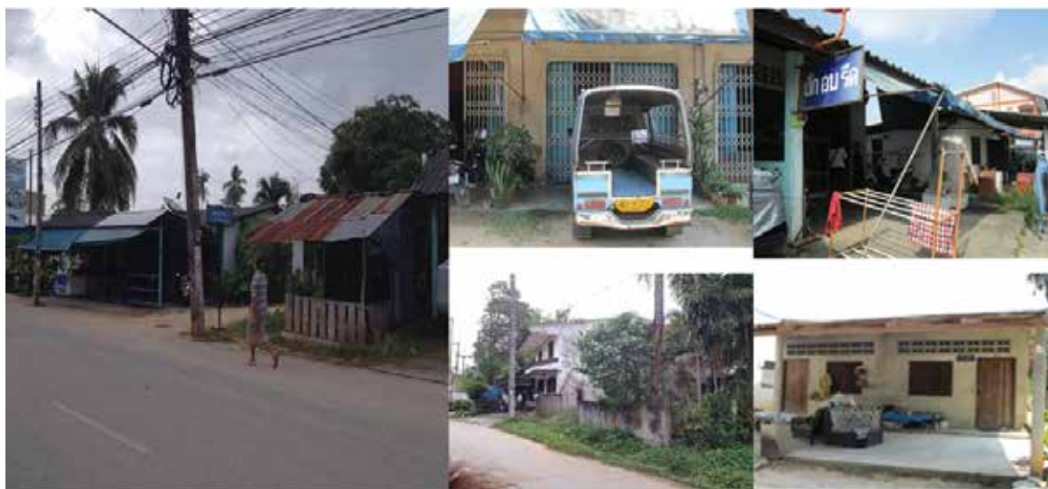
ภาพที่ 2 ลักษณะพื้นที่บ้านคลองหะปัจจุบัน ( พ.ศ. 2557)

ปี 2557 บ้านคลองหะมีประชากร 3,655 ครครัวเรือน หรือ 6,011 คน ส่วนใหญ่ประกอบอาชีพธุรกิจส่วนตัวร้อยละ 55 รับจ้างร้อยละ 35 และการเกษตรร้อยละ 15 คนบ้านคลองหะมีการช่วยเหลือกันอยู่บ้างภายในเครือญาติ ส่วนการช่วยเหลืองานชุมชนนั้นกระจุกอยู่เฉพาะในกลุ่มผู้นำเท่านั้น และที่สำคัญคนในคลองหะแบ่งออกเป็นหลายฝ่าย และมีหลายระดับ ทั้งคนจนและคนรวย ตั้งแต่ปี 2555 เป็นต้นมา เทศบาลเมืองคอหงส์ภายใต้การบริหารของคณะผู้บริหารชุดใหม่ ได้แบ่งชุมชนบ้านคลองหะออกเป็น 4 เขต โดยใช้ถนนเป็นเส้นแบ่ง และกำหนดให้มีคณะกรรมการชุมชนในแต่ละเขต จากการสัมภาษณ์แกนนำชุมชนและกรณีศึกษาบางคน ได้ข้อสรุปว่า การแบ่งเขตรับผิดชอบโดยคณะกรรมการชุมชน 4 ชุดที่แต่งตั้งโดยเทศบาลส่งผลให้เกิดการแบ่งแยกการทำกิจกรรมร่วมกันของคนในชุมชนออกเป็นเขตตามพื้นที่ ทำให้ความร่วมมือร่วมใจระหว่างคนในชุมชนยิ่งลดน้อยลงไปอีก